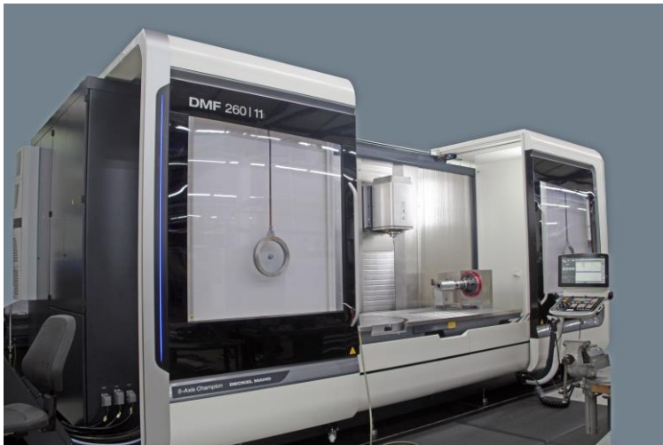
DMG Bearbeitungszentrum DMF 260 mit WALTER TANIH 250/300 NEG

Mit einer kundenspezifischen, universell einsetzbaren Werkstückspanneinrichtung kann eine schnelle Rüstzeit und eine äußerst flexible Fertigung gewährleistet werden. Durch den Schwenkkopf der Maschine können Teile simultan in bis zu 5 Achsen bearbeitet werden.